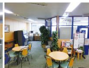
ラウンジ (約144平方メートル) ・テーブル個数: 4個 ・椅子個数: 20脚 ・50インチ液晶テレビ ・DVDプレイヤー